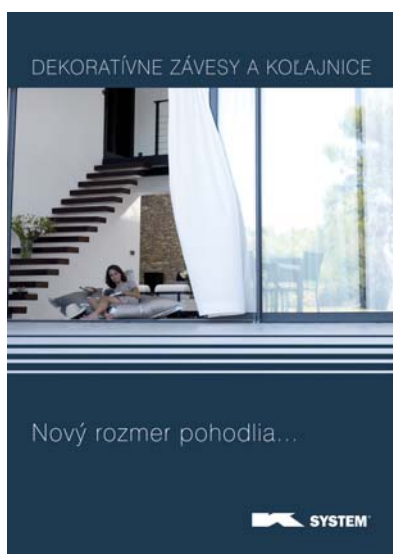
Dekoratívne závesy a koľajnice