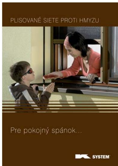
Plisované siete proti hmyzu