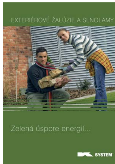
Exteriérové žalúzie a slnolamy